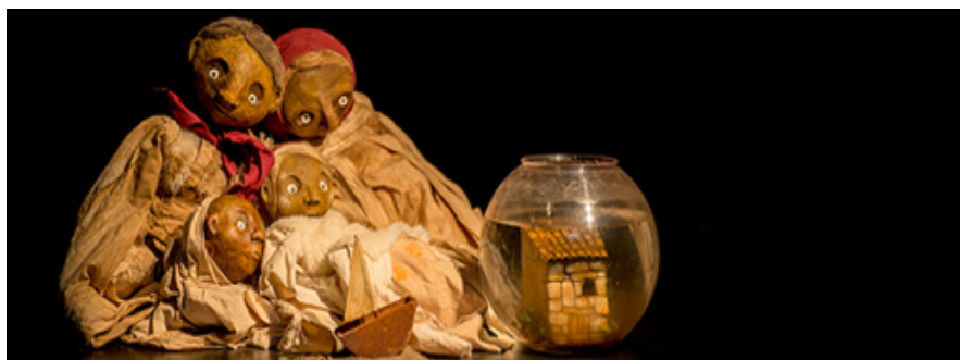
Imagen de Hubo.

La historia de El Patio Teatro ha ido muy de la mano de la Fira de Titelles de Lleida, donde estrenaron su primer espectáculo, A Mano , con una gran acogida hace 6 años. Ahora vuelven a casa con el espectáculo de reciente creación Hubo y a estrenar su último trabajo: Conservando Memoria . Ambos espectáculos de pequeño formato, con objetos y títeres y, sobre todo, mucha emoción, como ya la tenía su trabajo anterior.