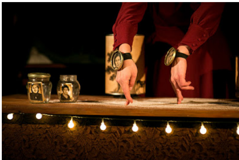
Un momento del espectáculo Conservando memoria , de El Patio Teatro

Los premios FETEN que se otorgan al término de la feria suponen el reconocimiento del sector profesional y en consecuencia, una marca de calidad . El acto de entrega tuvo lugar en el Patio del Centro de Cultura Antiguo Instituto el viernes 14 de febrero, para acabar de enamorar a todos los ya apasionados por las artes escénicas para la infancia.