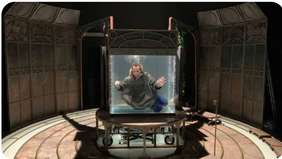
imágenes de los ensayos de BAJAU.

Para dar título a este espectáculo hemos escogido Bajau , el nombre de una tribu del sureste asiático que se ha adaptado a vivir, o al menos durante largos ratos, bajo el agua. Bajau es un viaje donde la versatilidad del elemento agua, nos conducirá a un nuevo universo, un nuevo medio, un lugar donde encontrarnos a nosotros mismos, encontrar nuestros orígenes y ser lo que realmente queremos ser.