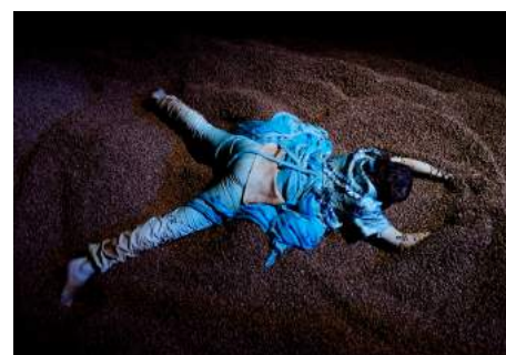
Imágenes de los espectáculos no convencionales de Ponten Pie.