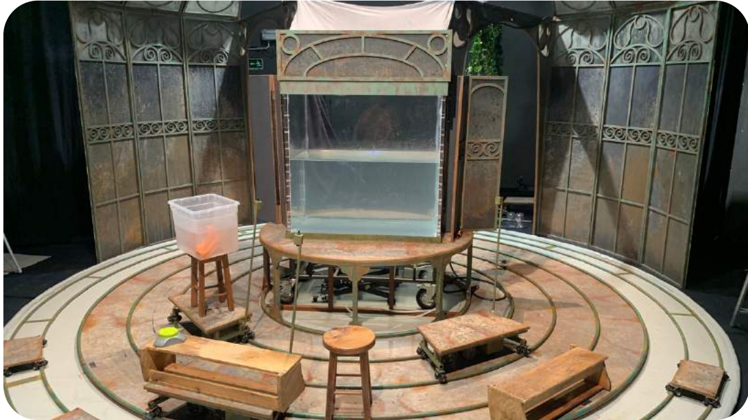
Imágenes de los ensayos de BAJAU