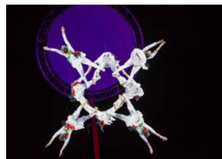
imágenes de los montajes para grandes eventos de Ponten Pie.