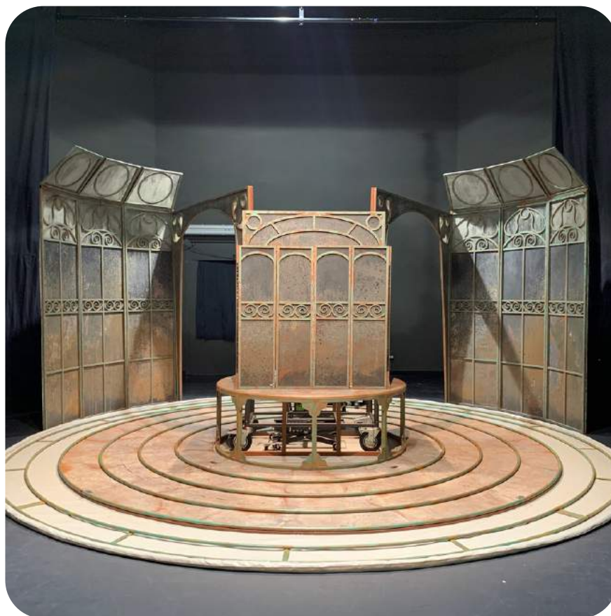
Imágenes de los ensayos de BAJAU.

El espectáculo se estructura como un viaje desde que uno de los personajes se da cuenta de que su cuerpo no corresponde con el medio en el que habita. Un viaje empieza con el descubrimiento del elemento agua y su vínculo con los personajes. Ellos quieren unirse a este universo y vivir en él. La metamorfosis empieza.